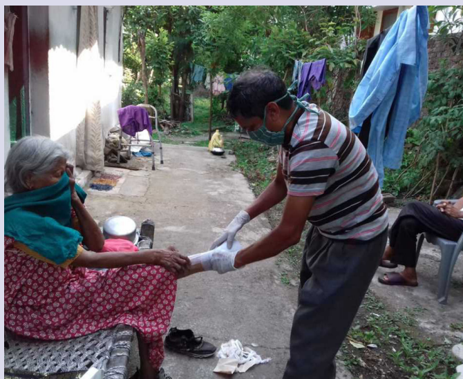
Verzorging van de melaatsen bij KKM

Het is vooral bemoedigend om te zien hoe onze vrienden in India onder de bezielende leiding van een paar jonge mensen nieuwe ideeën om inkomsten te genereren ontwikkelen en uitvoeren.