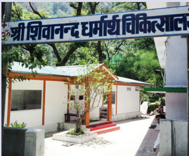
De Ayurvedische afdeling in Ganeshpur, Himalayas