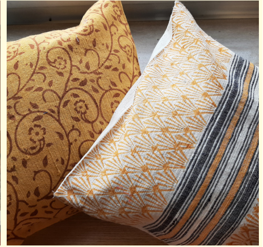
De nieuwe producten van KKM