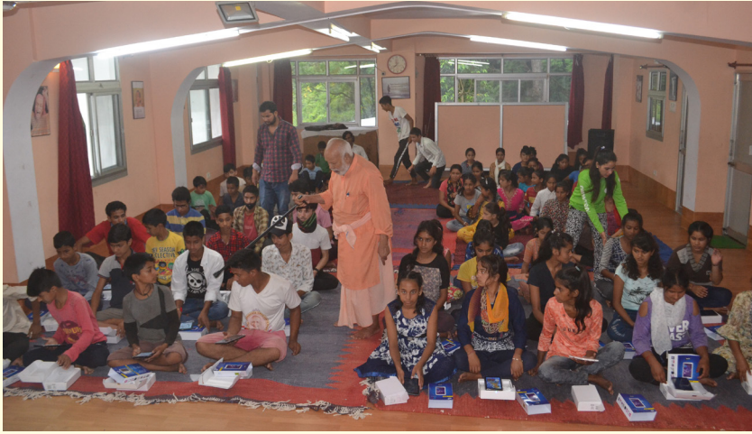
De uitreiking van tablets aan de kinderen van de bergdorpen