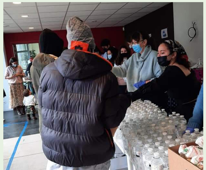
Voedselbedeling in Brussel